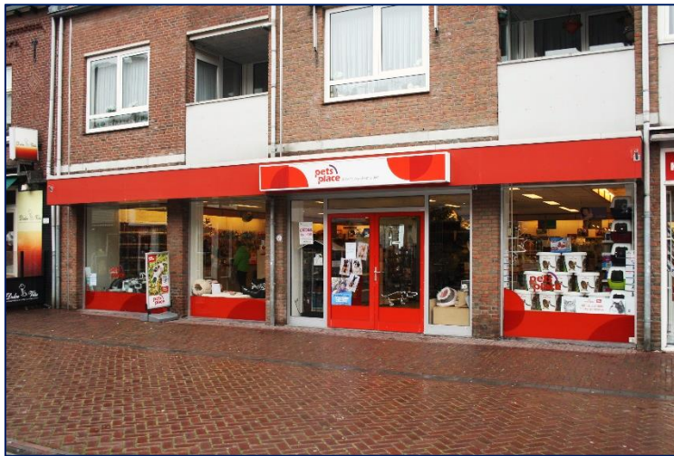
Echt, Bovenstestraat 37